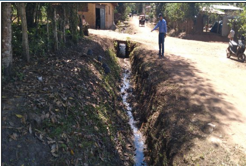
FOTOGRAFÍA N°01: EROSIÓN EN AMBAS MARGENES DE LA QUEBRADA YARINAICO