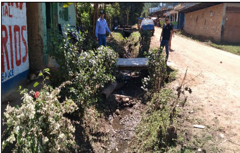
FOTOGRAFIA N°02: EROSIÓN DEL BORDO CERCA A VIVIENDAS QUE TAMBIEN AFECTARIA A